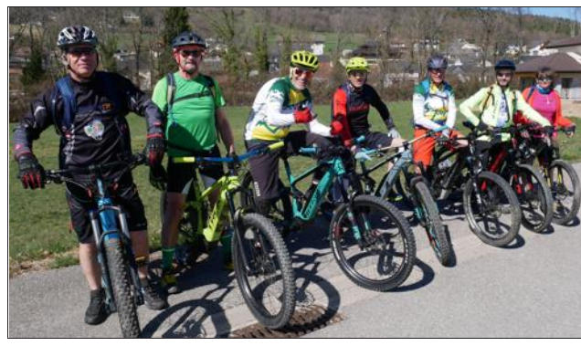
Discipline à part entière, le VTT à assistance électrique permet au débutant ou au moins sportif d'accéder à des parcours inaccessibles auparavant.

Cette saison, le Cyclo VTT Passion propose une section dédiée au VTT à assistance électrique (VTTAE) en complé-