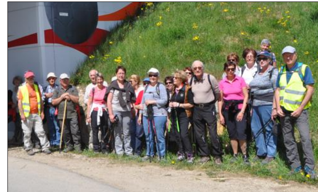
Sous le soleil, la randonnée c'est le pied.

Bien évidemment, ce sera à l'heure du déjeuner que tous se retrouveront pour le tradi-