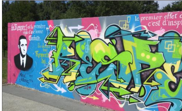
Un portrait ressemblant de l'ancien maire et initiateur du collège, orne le mur, dans la cour du collège.