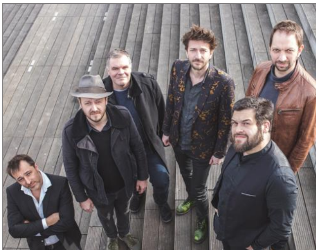
Le groupe Debout sur le Zinc, un hommage à Boris Vian.

C'est le prochain spectacle que proposera Ar(t)abesque le samedi 12 octobre à 20 h 30, au théâtre Jeanne-d'Arc et qui fera une grande place à un grand nom de la chanson et de la musique française, Boris Vian.