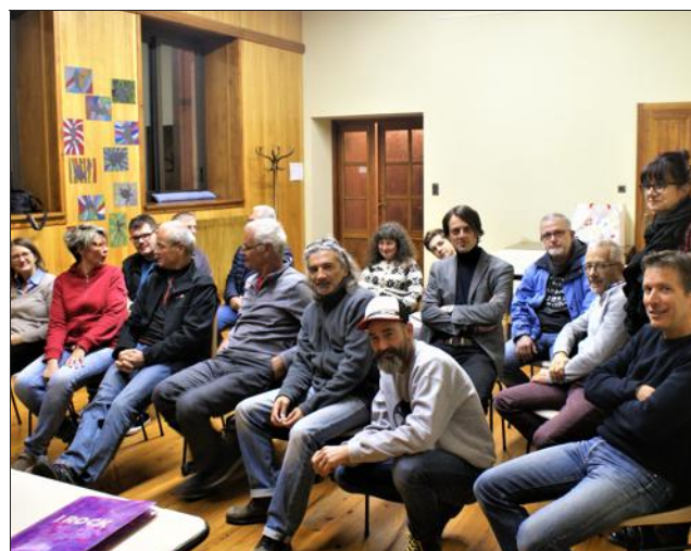
Une assemblée générale studieuse et décontractée.

La fête de l'association, qui regroupe pour une journée toutes les formations issues de Rock à l'Appel, qui a dû se dérouler à la salle des fêtes pour cause d'intempéries, n'y a rien perdu en ambiance et en