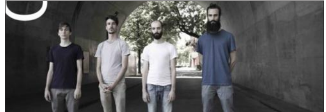
Le groupe lauréat du Tremplin 2018 est Oestetik. Ils joueront sur la Scène de Cybèle à Jazz à Vienne.