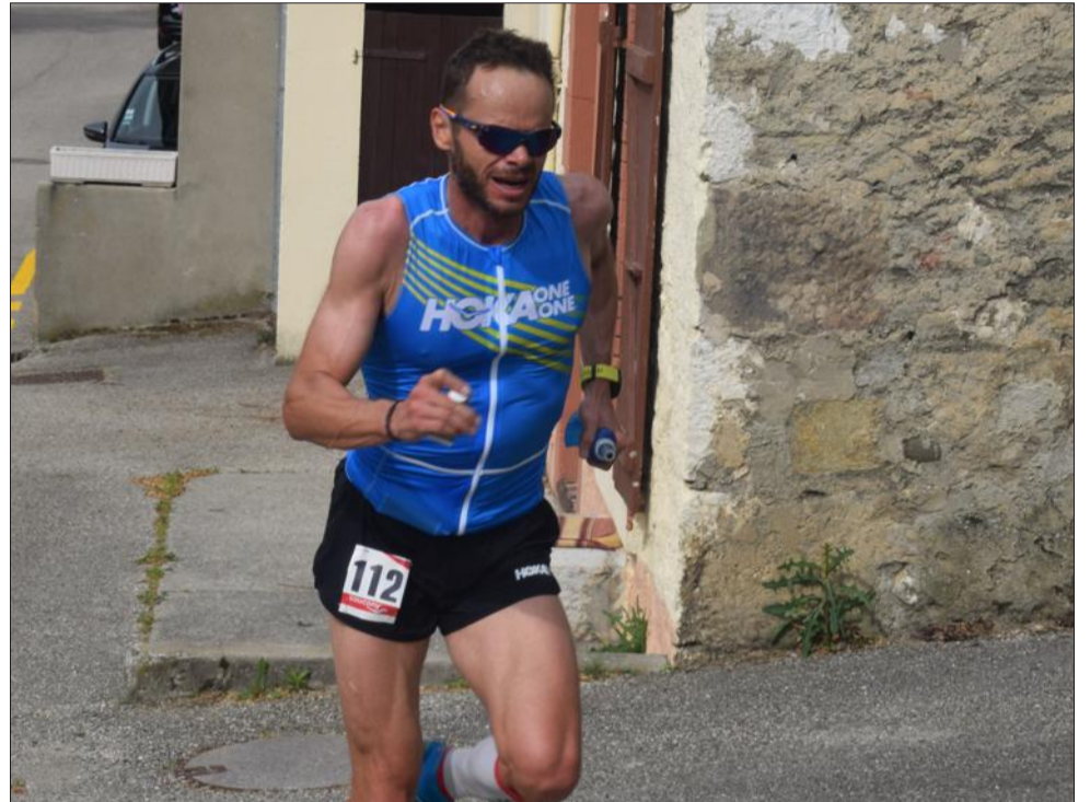
Le vainqueur de l'UTMB 2016 a assommé la concurrence en 1h09'52".