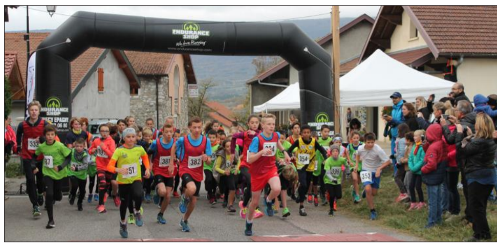
Les jeunes des écoles d'athlétisme ont aussi eu droit à leur cross.