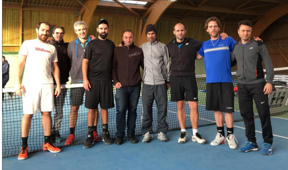
Duel de toute beauté entre Ferney-Voltaire et Montpellier.

Le TCFV commençait bien avec une victoire de Rebol-Salze en deux sets mais manquant de chance pour Senelle